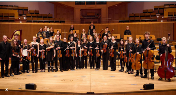
Orchesterkonzert der Städtischen Musikschule Bamberg