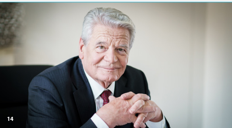
Joachim Gauck

Eine Anmeldung zu Kursen ist online ab 3. Februar 2025 möglich über die Homepage www.vhs-bamberg-land.de oder schriftlich mit einem Anmeldeformular bei einer der Außenstellen im Landkreis oder bei der Geschäftsstelle. Ein gedrucktes Heft liegt an über 120 Stellen im ganzen Landkreis in Gemeinden, Banken und Geschäften aus. ab 03. Februar | www.vhs-bamberg-land.de