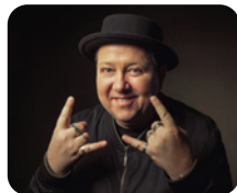
Sebastian Krumbiegel 01.02.2025 | 19:30 Uhr Bürgerhaus Lechner Bräu Baunach