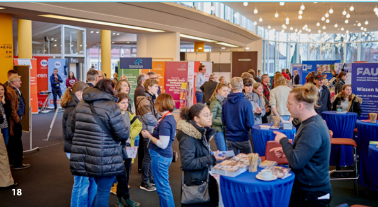
Studienmesse:BA 2024

22. Februar | 10:00 – 14:00 Uhr | Konzerthalle, Bamberg