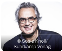
Friedrich Ani 12.02.2025 | 19:30 Uhr Bauernmuseum Frensdorf