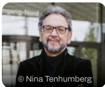
Prof. Dr. Heribert Prantl 06.02.2025 | 19:30 Uhr Kulturboden Hallstadt