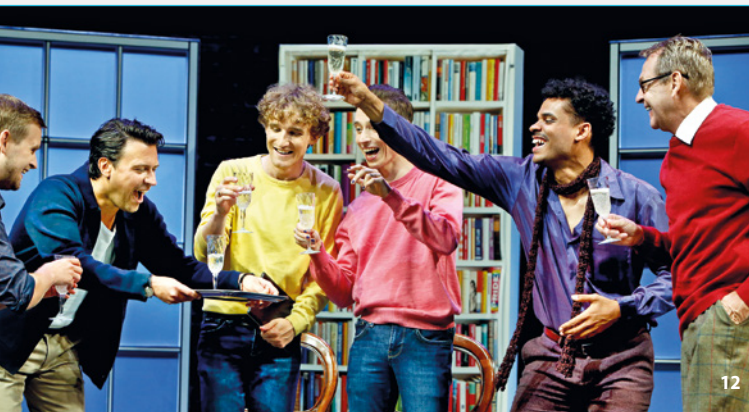
Das Vermächtnis – Teil 1