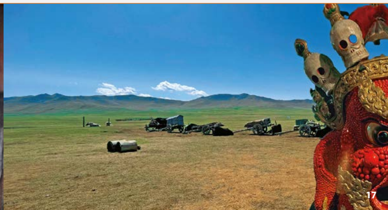
Mongolisches-Deutsches Naadam-Fest

12. Juli, 20:00 Uhr, Gastwirtschaft Zum Wirt, Stappenbach