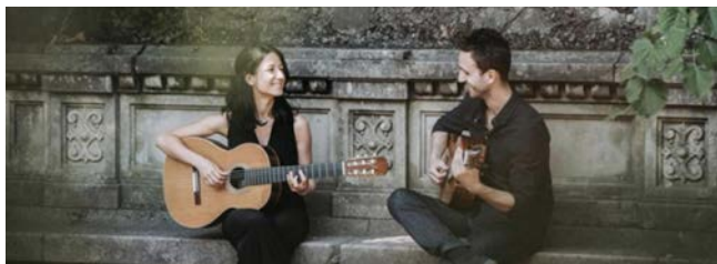
19:30 | Neues Palais im Gartenhaus Bamberg [35]