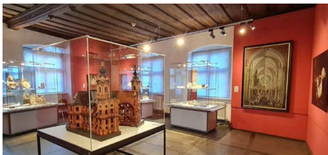
15:00 | Historisches Museum Bamberg [38]

Weitere Führungen finden Sie auf Seite 26 ff.