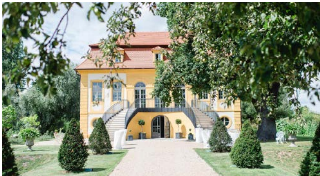
20:00 | Aufseßhöflein (Zugang Bahnübergang Coburger Straße) Bamberg

„The New World“ – Folklore, Jazz u. Klassik aus den USA für Violine u. Klavier mit Werken von Samuel Barber, Amy Beach und George Gershwin. VVK: rubin@chamber-players.de