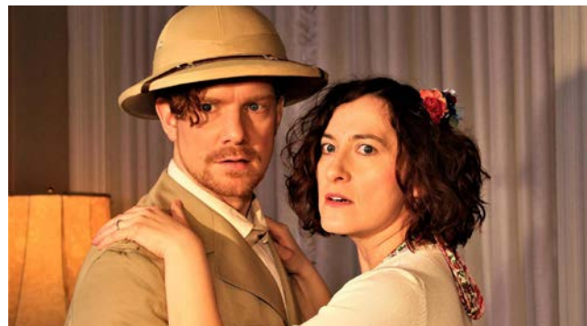
20:00 | ODEON – Kino &amp; Café Bamberg