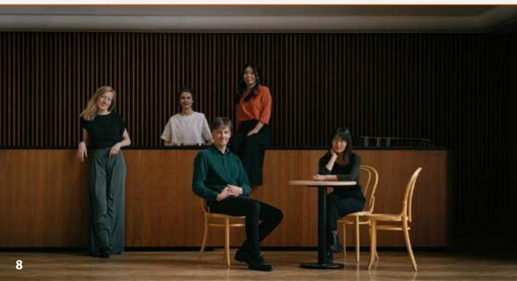
Ensemble L'Anima